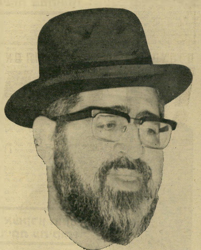
הרב הראשי יוסף

עיקרית של מיבצע-הקומנדו הקדוש: גורן לא שינה את ההלכה. ואפילו לא פירש אותה מחדש. הוא עשה מה שעשה בצורת "פאטנט" — או בלשון פשוטה, בצורת תחבולה. שלמה גורן יכול היה להיות גי' בור אמיתי, אילו כינס את מיטב הרבנים, והציע להם לפרש מחדש את ההלכה, כרוח המאה ה-20. כך היה נוגע לשורש הדברים. הדבר היה מחייב קרב אמיתי, ויכוח רעיוני ודתי, מאבק מצפוני ומוסרי. אך גורן אף לא חלם לסכן עצמו בצורה כזאת. שום דבר לא שונה. לא גובש שום כדל חדש, שיעזור מחר למי זרים אחרים, או לפסולייחיתון אחי ריב. פשוט נמצאה תחבולה, בזוויה למדי, כדי לסלק בעייה של מיקרה בפויים, שלא היה נוח לשילטון. שיטה כזאת של "פאטנטים" אינה זרה ליהדות. בימי התלמוד ולאחר מכן נודעו תחבולות רבות. כמו זו של "קניא דרבא" (הקנה של רבא). מעשה בנתבע שלוה מטבעות כסף מן התובע, והתכוון להישבע שכבר החזיר לו את הכסף. הוא התיר לה, הופיע בפני הרבנים כשהוא נשען על מקל, ובשעה ששם את ידו על התנ"ך