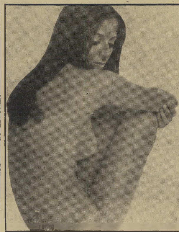
שירים אלו בתקופת ההריון ובמשך המחזור החודשי (כן

"Eterna 27" — Super Emollient Lotion for the body תכשיר עסוי לגוף עשיר בחמרי עדרן ובלחות — התכשיר הנו תחליב ומבושם בעל הרכב עשיר של תכשירי לחות ושמנים מזוככים בשלוב עם ה"Progenitin" התכשיר המשיי נספג מיד, ואינו משאיר עקבות שומן. נשים שתנאי אקלים או הזנחה בטפול עור הגוף זירזו את תהליכי ההתבגרות בעורן, או נשים שהפחתו ממשקלן בצורה דראסטי, תמצאנה כי תכשיר זה יחזיר לעור גופן את גמישותן, רענותן ורכותן בעקבות עסוי יום יומי. הערת: הפרוגינטיין אינו הורמון, ואין לו את תוצאות