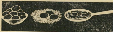
א ב ג

אין עיתון רציני בארץ שלא עורך לקוראיו, לפחות פעם אחת בשבוע, מיבחן פטיכולוגי. השיטה היא פשוטה. לא צריך להיות פטיכולוג בשבילה. כל מה שעליך לעשות הוא: להתבונן בתמונות שלפניך; לענות על השאלות להלן (אבל בכנות, הא?!) ואחר-