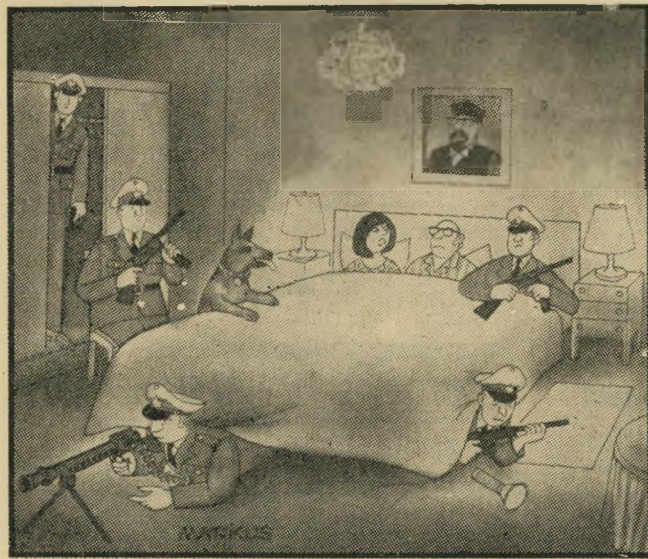
„אמרתי לך שכדאי יותר להיות קונסול בכורמה מאשר שגריר ישראל בבון!“

הטלפון מצלצל במשרדו של מר שולץ, איל-הון ישראלי. שולץ: הלן, מי זה? מי מדבר? הקול: כאן מדברים מהמאפיה!