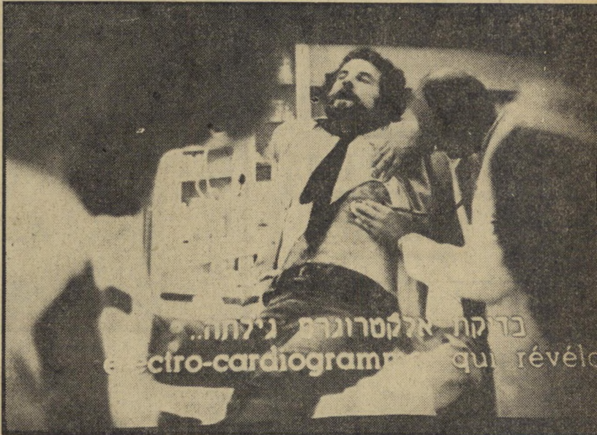
ברית אלקטרוגרם גילתה... electro-cardiogram qui révéla

כך יושבים וממתנים לתורם חולים ופצועים, לני תים שעות. כאן — שני ערבים, פועלי בניין, שנפצעו ברגליהם בתאונת עבודה. ביניהם נשרה שהיתה אחוזת יאוש כה גדול, עד כי טרבה בכלל לדבר. אלה שפציעתם, או מחלתם קשה יותר מבליים את שעות הצפייה על המיטות, מאחורי הפרגודים בחדר המיון בהמתנה לרופא בחדר המיון שיגיש אליהם.