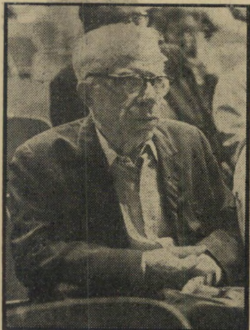
מנהיג מפ"ם יערי נדר של שתיקה

להיראות בשום פנים "מקור לגאווה" או "חולשה סנוביסטית". בלשון של בני-אדם נורמליים זוהי פשוט רמאות ורדיפת-בצע. אם רוצה אמנם שוקן "מיסגרת חוקית שתאפשר לתופעה להתקיים בלי לעורר בעיות מיותרות" הרי כל מה שהיה צריך לעשות הוא להציע לכנסת לקבל את הצעת התיקון הבאה לפקודת העתיקות: "פקודת העתיקות אינה חלה על כל אדם שהוא בעל עין אחת, רמטכ"ל צה"ל לשעבר וכיהן לפחות חמש שנים כשרי הביטחון בממשלת ישראל."