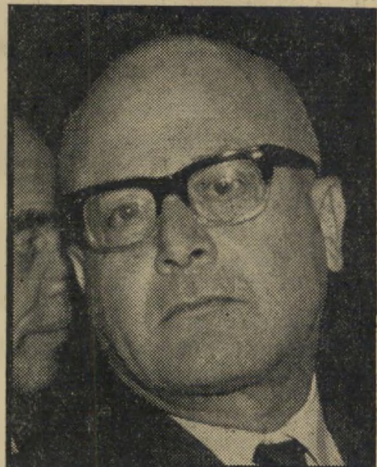
עורך שוקן בקבוקי טמפו ישנים

עתה יצטרך בית-המשפט להחליט, אם אכן נפל מנדל קוק קורבן שחא לדימיון מפתיע לגנב האלמוני.