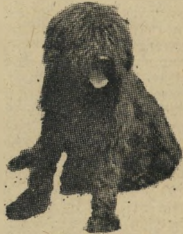
עיניים להם ולא יראו אוזניים