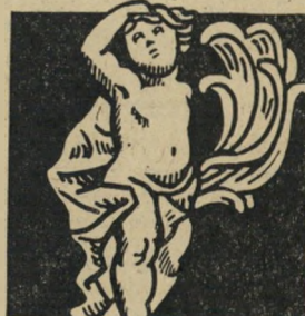
"וגם מפה לא רואים אפילו את התחת שלו"

מקרוב ת', אדם קטן בגופו ובאופיו; חונף, מלשין. "לקחו את המיקרוב הזה ושמו אותו בראש כל העסק. הם עוד יאכלו את עצמם". א, "כן, הוא דווקא די סימפטי, אין לי אליו כלום — רק זה שהוא מקיף את עצמו במיקרובים האלה, זה קצת מעורר חשד."