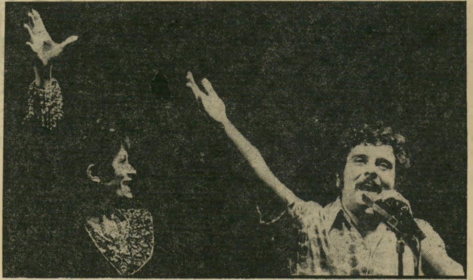
נפגשו השבוע בתחרות מלכת-המים. היה זה אחי רי שיפה סיימה לשיר וירדה אל מאחרי הקלעים. כשדודו עלה מייד אחריה כדי להופיע, היא זינקה חזרה לבמה. תפסה אותו, ואמרה: "אני יודעת שאהה תמיד מחקה אותי בהופעות שלך. עכשיו אני רוצה לשמוע במו אוזני את החיקוי!" דודו ניסה להתחמק אך לא עזר לו והוא החל שר את השיר של הזמרת שהצטרפה אליו לקול מחיאות הכפיים של הקהל.