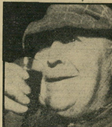
דוחם-מחותרת כהצער והחמלה הטלוויזיה הצרפתית לא בעסק

● גפן על בושס: „...הסיפור האיום ביותר שקראתי בחיי. זכה בתחרות הסי-פור הרע... אשפה גראפומנית אמיתית...“ ● קינן על גפן: מחזה הטלוויזיה היי-אחרון שלו היה יצירה מונולוגאית. היי-תי ממציא למנוול הזה מין עם מצחיק, נכון מליכושע שמאלץ... אשכוליו הנפל חיים של מליכושע שמאלץ שכוליים מעל