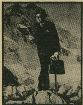
הז'ורנל היה מותח ולא הרגשתי לאן נתקעת.