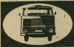
המלפנים של הטרומוכיד

מדור זה הוא תוספת למגזר המפורסם של דן בן-אנוש ונתיבה בן-יהודה. הקוראים מוזמנים לשלוח למערכת מלים וכתיבם משלהם.