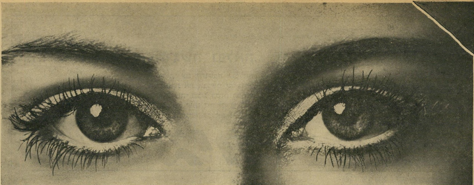
מראה עיני מלכת המזרח