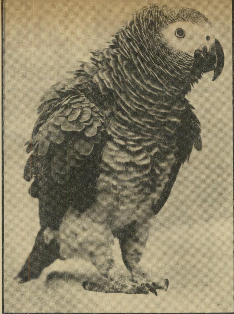
יוסי או קוקו איך להכיר —

יוסי נכהל. הבאתי את יוסי — זה שמו של התוכי — מגאנה לפני חמש וח