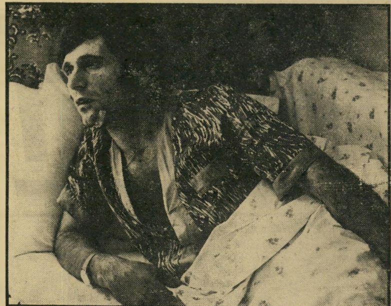
ספירו אחרי החטיפה — או רומנטיות פחות ?

שזה לא נכון. אני לא מבינה מאיפה שמש ידע באותו לילה של החטיפה שספירו יחזור עד שעה 11.