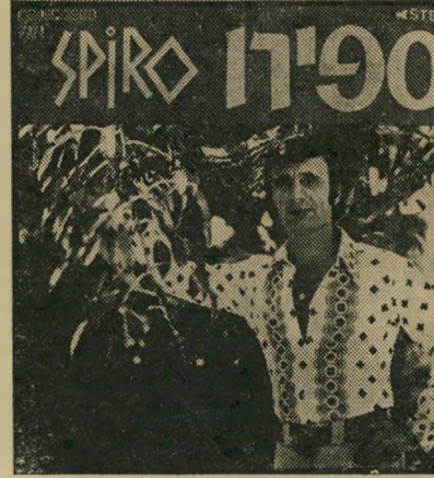
ספירו לפני החטיפה סיבות רומנטיות —

התעלפתי. לאחר שהוציאו את האוטו מהחולות, מוטק'ה התחיל לטפל בי. הוא היכה אותי באגרופים, וחנק אותי. הוא לחץ את ידי על הגרון שלי ושאל: „אתה