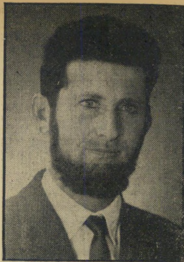
מותה פהג עסקי גופות

מערכת טירור. השמועה על גילוי" של פראייר עוברת במהירות מפה לאוזן בחוגי המהמרים המקצועיים בתל-אביב. תוך זמן קצר הגיע קישון, באמצעות צי" גלה, לחברות אחרות של מהמרים. הפס" 26