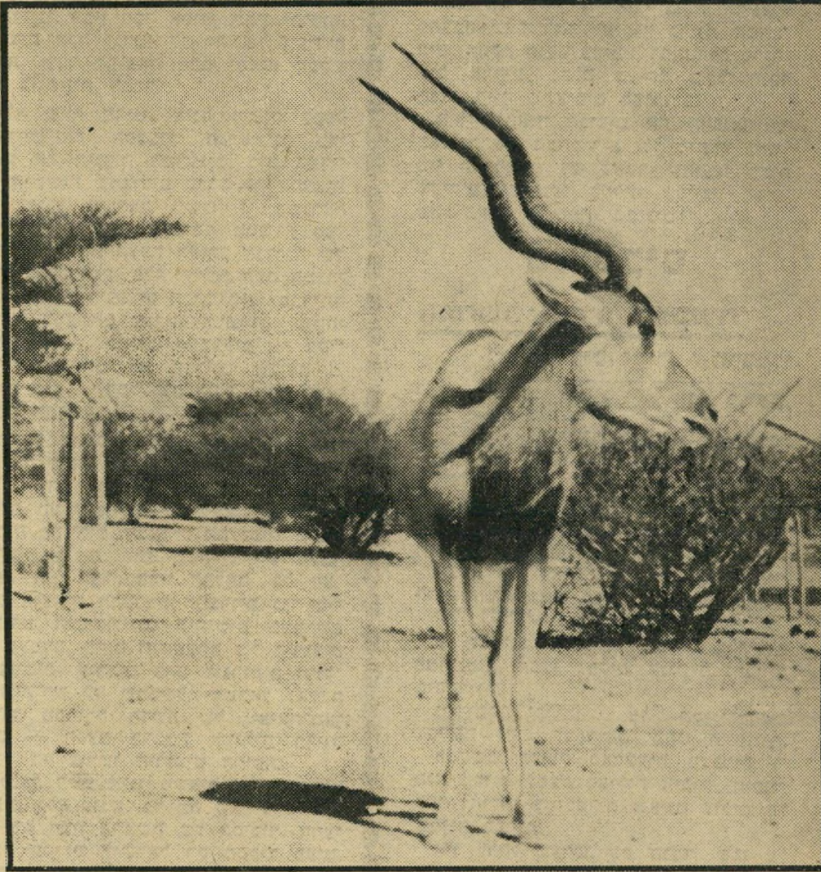
דישון ב"חיבר" — כאשר ידבנו ליבו.

כמה עזרה ראם? מתוך 32 אלף הדומים גודרו כבר 12 אלף. מאחורי הגדרות ניתן לראות עתה עדר יפה של פראים, שהם סוג של חמורי בר קדומים, דישונים שהם זן נדיר של אנטילופות בעלות קרני ענק המיסתלסלות אל-על, יענים — עופות בגודל גמלים ובצורה דומה, עדר מרהיב של צבאים מסוג גולה דורקס ואחרים. לאחרונה הטילו היענים ביצים, בשעה טובה, ודור חדש של עופות ענק אלה התבקע בישראל. דוגמה למחירים שעל הרשות להשליש עבור החיות, יש בסיפור הבא: בחודש יוני 1970, הגיעו שלושת ה"הסברה של אגודת חיבר (כולן פועלות