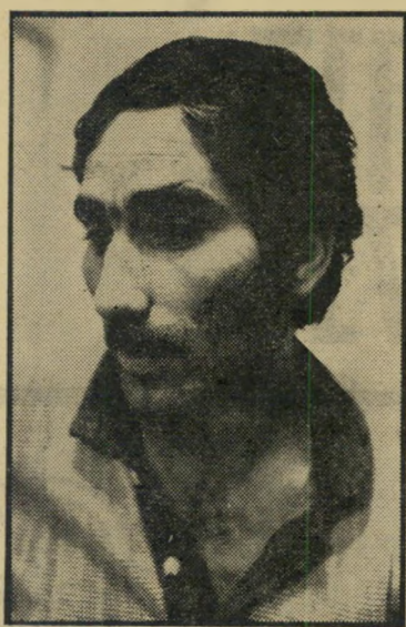
שוכת אברגילי מבית-החולים לבית-הכלא

מידחמת האהוזים. אלה היו גם הס' בות שגררו את כיסאות ישראל לסכך השביתה. ובכל זאת, החליט מישרד המיס' חר ותתעשייה, שהיה מודע לתחללים ללכת לקראת המיפעל ולסייע להתאוששות. ה' מישרד הסכים להלוות 2.5 מיליון לבעלים.