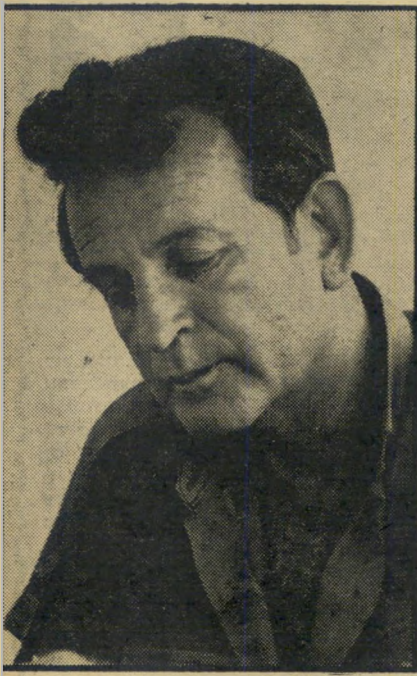
יוזם ומנהיג — צאן איש איש

„ואני אתן למישטרה לעצור אותה”, אומר בעלה כשמעות הונקות את גרונו, „משום שאין לי 165 לירות לבית-החולים.” סכום זה נשמע כיום אגדי עבור ה' מחסנאי הנכה משדרות. רק השבוע נעתרו שני בנקים בעיירה להלוות לו סכומי כסף כדי שיוכל לפרוע את 700 זל"י שהוא