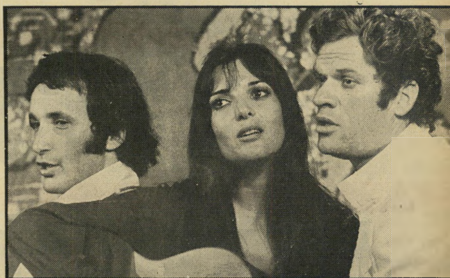
„השטן ואשת האיכר” (ברנזון, טל וגרנות)