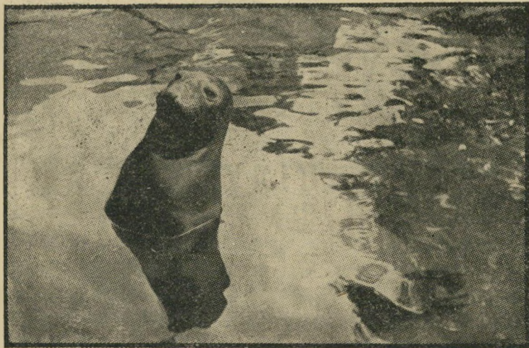
— סוכן ישראלי!