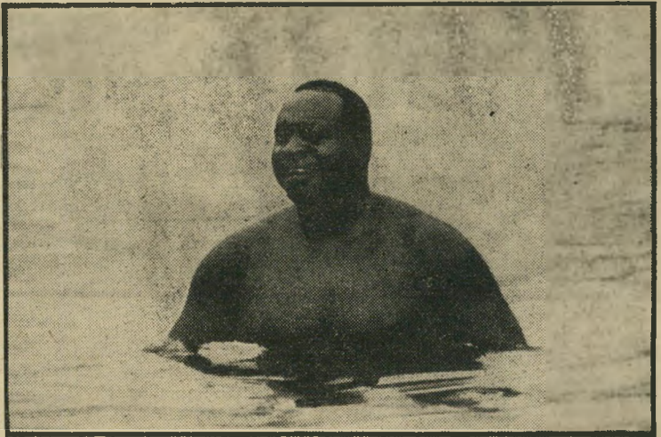
— שוב תפסתי