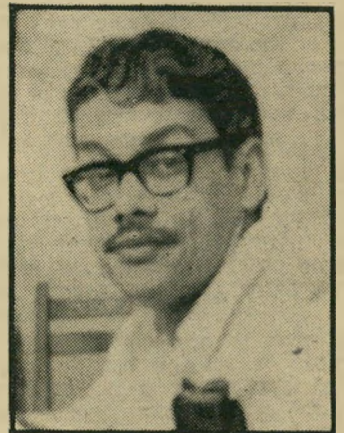
אלכס מסים הנצחת המליחמה

הודית בריבונות שתי המדינות, יש" ראל ופלסטין, חווה שלום וערביות מדיניות וצבאיות הדדיות — יהיה ויכוח סביבו ולא תהיה אחדות-דעות להצדקתו. ממשלה ישראלית שתפעל על בסיס מדיני כזה, רק לה תהיה הזכות המוסרית הלאומית לפעול פעור לה צבאית, נגד האירוגנים הצבאיים הרוצים להקים "פלסטין דימוקראטית"