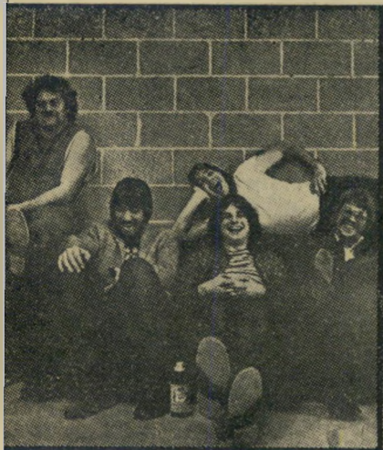
להקת „נחש מי“ חזרה אל הזוהר

אך במסעם העתיק חדש לפגוש מתיימים ותיקים (חוץ מן הזב הרץ וים של