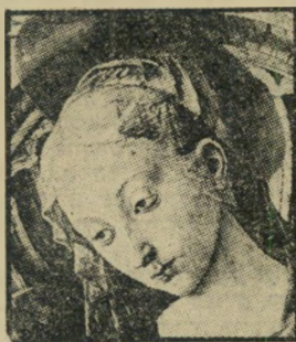
הוא לא כדיכך איי-איי..."