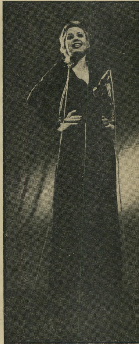
זמרת חווה אלברשטיין סוף-סוף קצת תרבות

מכל הזמרות המוקדשות את נוף הבידור הישראלי בפזמוניהן. חווה אלברשטיין היא אולי הקפדנית ביותר בבחירת הרפרטור.