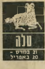
21 במרץ - 20 באפריל

דווקא ביום בו חשבת שכבר נשבר הכל, ושוב אין מוצא ממצב מסוין - אתה הופך ל"אדם אחר. הכל נפתר בנקל, חלק, בלי בעיות. זהו שבוע בו טוב תעשה, אם תרבה ב"קשרים חברתיים, בפגישות עם בני שני המינים השונים, אך היזהר, במיקצת, על דרכי הנשימה שלך. בת טלה: לבשי רודו.