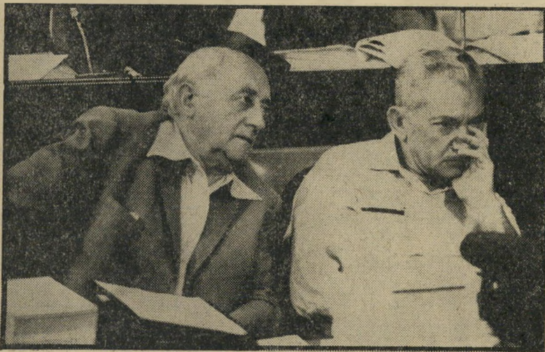
שר-התיירות משה קול (משמאל) עם חיים בר-לב

לנימוקי הכסף והישובי הכדאיות. לפני 25 שנה הקמנו מדינה. היא עלתה לנו ביוקר. מחצית יובל שנים אינה תקופה ארוכה בתולדות עם ומדינה. אבל זהו פרק הי מהייב סיכום-ביניים. והנה בא שריהתיירות ונושא את קולו: אלדי! מילכך צה"ל אין לנו מה לתראות לתיירות! אין לנו מה להציג בפני יהודים טובים וגויים עשירים, וגם לא בכפני עיירות-הפיתוח! בכל שאר השטחים עלובים אנחנו, הדי-ליימעש וקטני-קומה. אין מה להראות. רק צה"ל יכול להציל אותנו מן הבושה. לאמור: צה"ל אינו אחד מסמלי המדינה, אחד מהשיגיה הרבים והמגוונים. צה"ל הוא הסמל הייחודי, ההישג האחד. לזה, כבוד השר וכבוד הליברל וכבוד העצמאי, איני יכול להסכים.