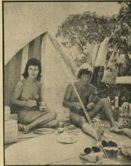
פיקניה השמש והמייס הם מת-אבנים נפלאים, ומיספר הצידניות וערימות המזון מעיד על כך.