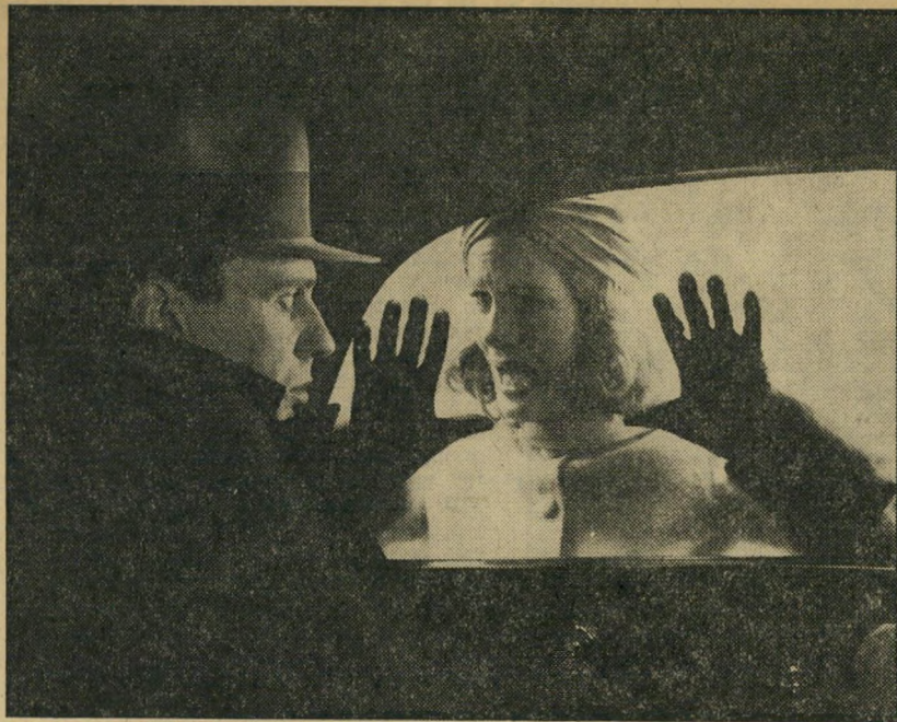
4. הקונפורמיסט (איטליה-צרפת)