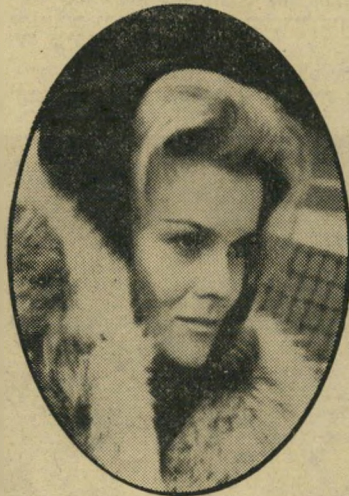
שחקנית מישנה השנה: