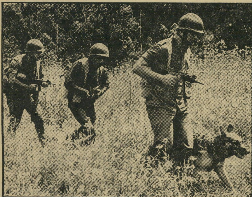
4. עזית כלבת הצנחנים (ישראל)