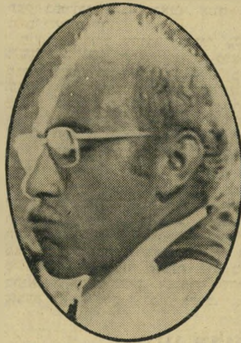
שחקן מישנה השנה: