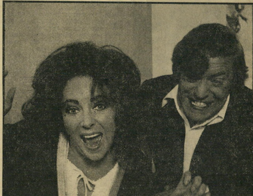
3. משחקה של זי (אנגליה)