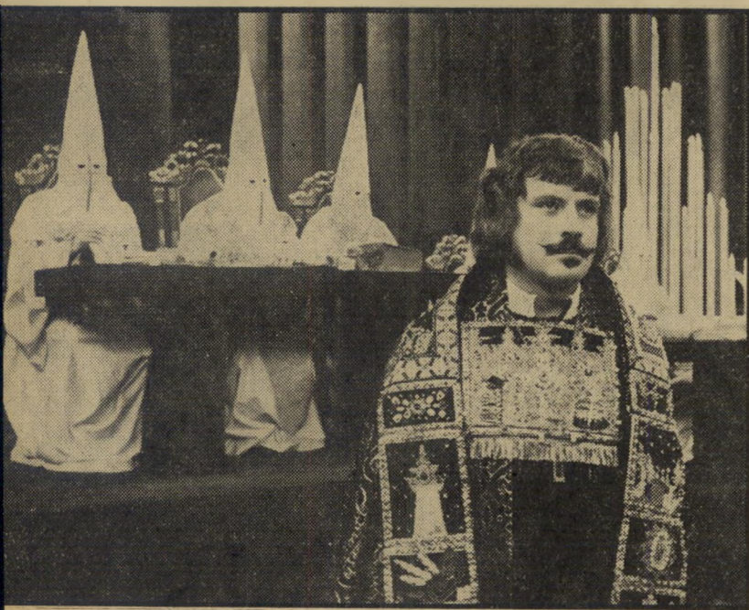
2. שדים (אנגליה)