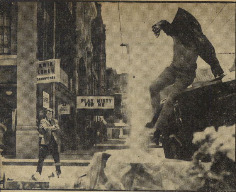
2. הארי המזוהם (ארה"ב)