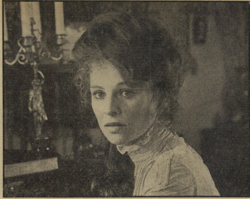
1. המקשר (אנגליה)