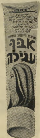
ביטוי אבפי נעים