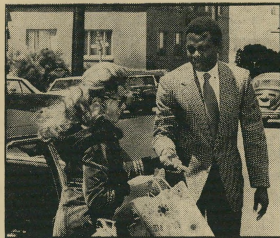
פואטיה ונורת: הפשע משתלם

כל העניין טובב על תבורת צעירים שנפגעו בצורה זו או אחרת מן המיסחר בסמים ומחליטים לצאת נגד מפיצי-הם בחוף המערבי. לשם כך הם מגייסים את עזרתו של השוטרי הישר (טיבס) ומתוך ידיעה ברורה שלא כל השוטרים כמוהו, הם דורשים ממנו שלא ישתף בתוך מאבקם אף אחד אחר מלובשי המדים. הבמאי דון מדפורד מקטש את הסיפור בכמה רציחות קשוחות, במעי שה שוד לוליני, ובתנועה דקתנית, ברגל וברכב, שמטרתה העיקרית היא להסתיר בקצב שלה, את העובדה שסיבותיה מטושטשות למדי. המסקנה הסופית של הסרט תואמת בעצם את מוסר ההשכל של כל סירטי הפשע בתקופה האחרונה: החברה חסרת ישע מול „האירגון“ שדואג למחוק את עקבותיו, ומנהיגו האמיתיים אינם נפגעים לעולם. כאשר רואים שוב את המשטרה שכמה מנציגיה,