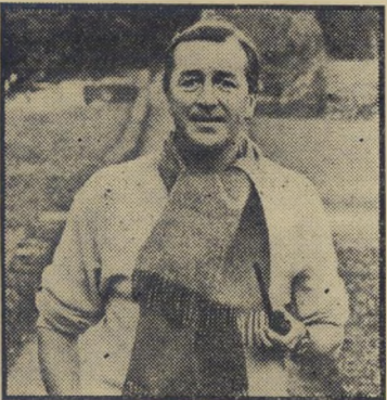
בעז בודט — ללמוד להיות —

ועור לדייוויד לין בכל תסריטיו הגרנדיוזיים, החל מלורנס איש ערב, דוקטור זיאוואג וכלה בבנו של ריאן, לאחר שהוכיח את כוחו כמחזאי וכתסריטאי, החליט כי הגיע הזמן להפוך לבמאי, ולעשות את צעדו הראשון עם קורות חייה הסוערים של ליידי קארלין לאמב. ובעצם, מדוע לא? "אני מעדיף תמיד עלילות מן העבר", אמר פעם בולט, "שם יכולים אנשים לדבר במליצות מבלי לספק למבקרים סיבות לעקם את האף." לא שזה חשוב כל כך לבולט. מן הביקורת התייאש כבר מזמן. כאשר כתב את מחזהו הראשון פריחת הדובדבן ונסע עימו לארצות-הברית, אחרי הצלחה לא רעה על בימות לונדון, נטפלו אליו המבקרים בעוקצנות והציעו לו ש"ישוב להוראה, בה עסק קודם, ובה הוא ודאי מוכשר יור מר מאשר במחזאות."