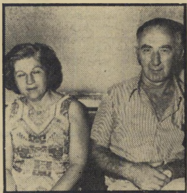
מתדוננים קופיטקו אין עניין בציבור

צו בעקומא. זה החל בכך שלמרות הצו לא הטריח עצמו איש להרוס את