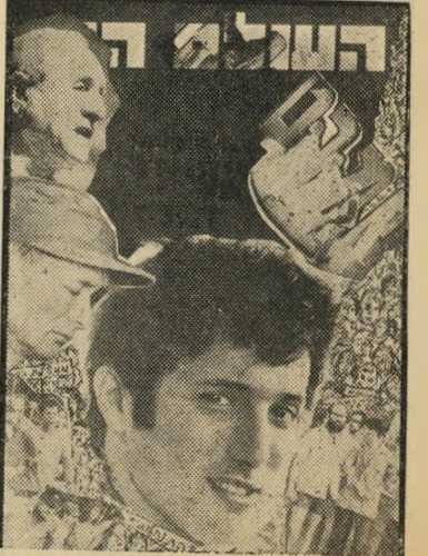
איש השנה תשל"ב