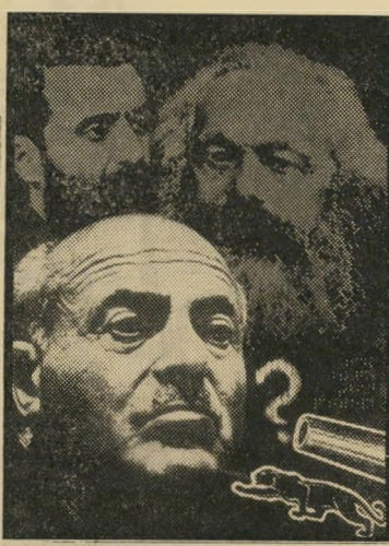
איש השנה תשל"א