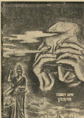
איש השנה תשכ"ב קורבן טובלן