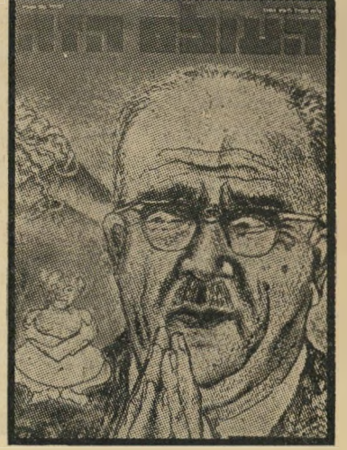
איש השנה תשכ"ד יורש אשכול