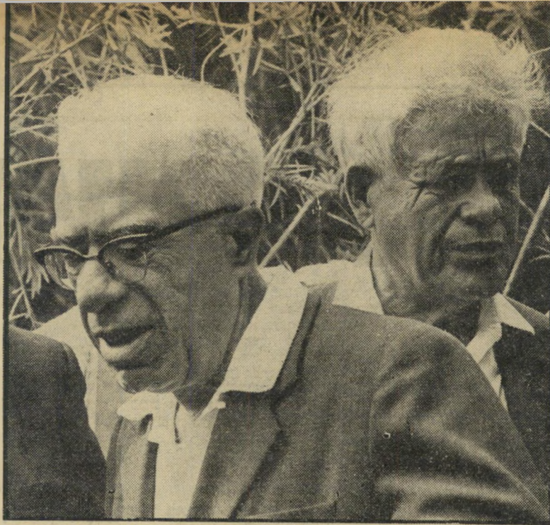
מנהיגי מפ"ם חזן ויערי מי ישא את הדגל האדום?

או חברי האגודה למניעת זיהום סביבתי. זו היתה הסיבה שיגאל אלון ביקש לשימור את דבר קיום פגישת התידורן בסוד. בתום הפגישה הוזמנו משתתפיה לפגישת תידורן נוספת, שנועדה להיערך ביום השני השבוע.