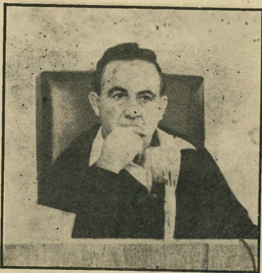
אלוף-ימיל זורע: עוד ברווזים?

ב משיך באותו פסוק. הנה: „פיגוי יפו“. האלוף-ימיל מנסה כאן להעלות פחדים מלפני 23 שנה, בימי ראשית המדינה, כאשר האגדה של „חזרת מיליון הפליטים“ הולכה אימים בציבור בישראל. כדי