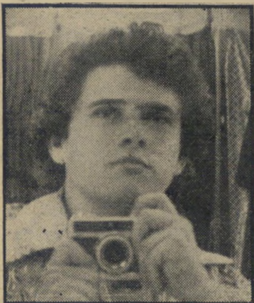
אריה וכרויט אבא הערמומי

רבין הסתבך בסיכסוך עם האיש הזה (אבא אבן) ונראה כאילו ידו על התחונה.