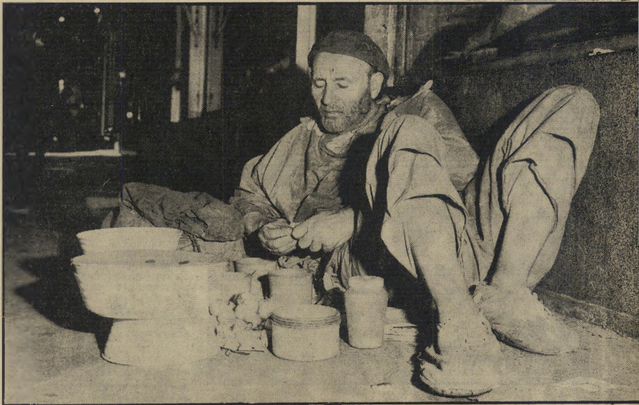
מידרכות רחוב הקבצנים של תל־אביב. הוא גורר את בית־מלאכתו בו הוא תופר לעצמו בגדים חדשים ומתקן את נעליו.

ובעצם למה? ריבקה. מקוב תעסוקה: אלנבי פינת לילינבלום, רחוב הדולר השחור. מיקי צוע: קבצנות, זימרת נכאים, הגדת עמ"י דות לעת מצוא. מחזור יומי ברונטו (ברור טרנטו): 100 ל"י. (מאה לירות ישראלי יות ליום) זאת בלי עבודה המצד, ללא