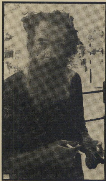
הנביא בעל השיא התל־אביבי ל"רונדלים בדינוגוף, פיו מלא כל העת במילמול חסר פשר ואת נדבותיו הוא מקבץ בדיוק בשביל כוסית קוניאק.