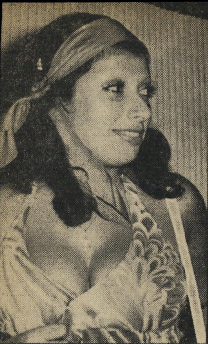
מחשור אי' אורחת-שופעת בריאות זו איפ' יינה את האופנה החשופה שבלטה בטקס החתונה מכל צד ומכל עבר ואבר.