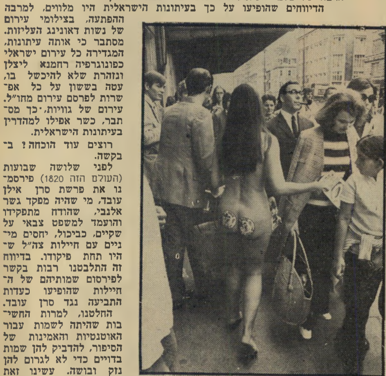
דוגמנות עירום ברחוב דאונינג בלונדון

מי שאוסף הוכחות לצביעות המקובלת בעיתונות הישראלית, יכול היה להסתמך השבוע בדיווחים על הפגנה שערכו מיספר נערות לונדוניות. כתעלול פירסום למופע פופ שנערך בבריטניה. הנערות האנגליות התפשטו עירומות ברחוב דאונינג 10, ליד משכנו של ראש-ממשלת בריטניה, לצהלתם הרבה של צלמי העיתונות והשוטרים ששמחו לעצורן.