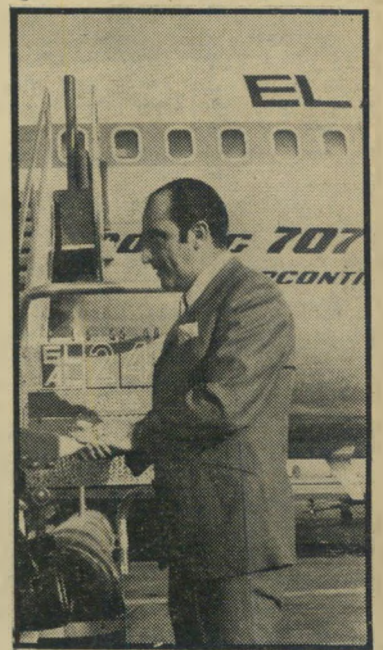
גודיק בנמיהתעופה כבוד המאפייה איימה ברצח

המחזה המוסיקלי הראשון שהציג, גביר וני הנאוה, היה סנסציה. היתה זו הפקה בקנה-מידה אמריקאית שישראל לא היתה רגילה בשממותה. הרווחים היו עצומים. גודיק, שפחד להמר לבדו על השקעה של מאות אלפי ל"י, התחלק ברווחים עם משי קיעים אלמוניים, שהמשיכו להשקיע גם בהפקותיו הבאות. הוא חקר את אולם אלהמברה ביפו, שיפץ אותו, הפך אותו