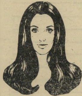
שאמה — זאלקה

מדור זה הוא תוספת למדור המפורסם של דן בן-אמוץ ונתיבה בן-יהודה. הקוראים מוזמנים לשרוח למערכת מלים וכינויים משהם.