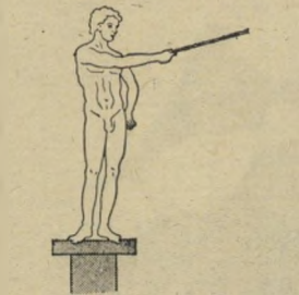
דאיפה? — לשמה!