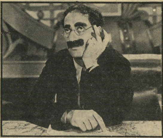
גרושו מרקס: שמות ברומנטיקה

אולם הפעם, שלא כבדרך כלל, הם התברכו גם בבמאי מעולה, לאו מקארי, שהגיע אליהם אחרי אמונים ארו"כים בסרטי לוקר והארדי, ומשום כך רבים האפקטים היוזר"אליים יותר מאשר במרבית סרטיהם האחרים.