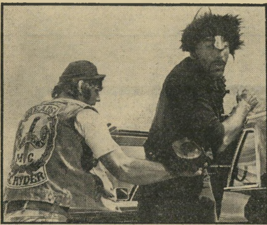
נמאט (משמאל): מכת פציעות

למרות הסבל הכרוך בצפייה בסרט בקולנוע תכלת, שעדיין עושה הפסקה באמצע ההקרנה, הטיולים בו נמ"שכים במשך דקות ארוכות לאחר תחילת הסרט, והמור"שבים מסודרים כך שכל אחד מסתיר לשני במידה מאקסי"מלית, למרות כל זאת, זה סרט שאסור להחמיץ.