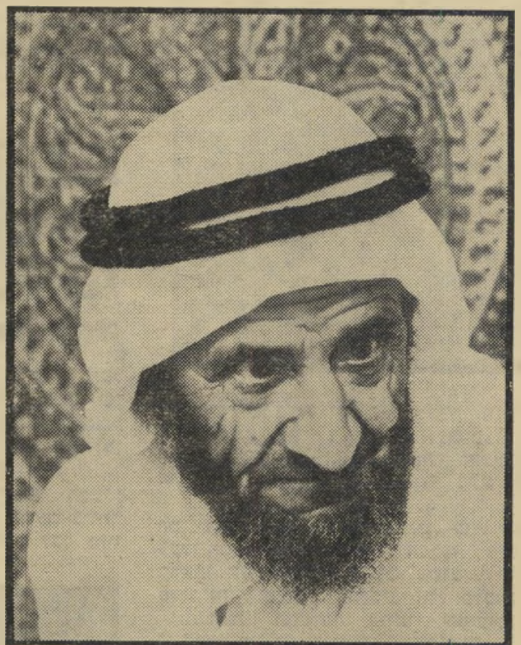
השייך של עקובה