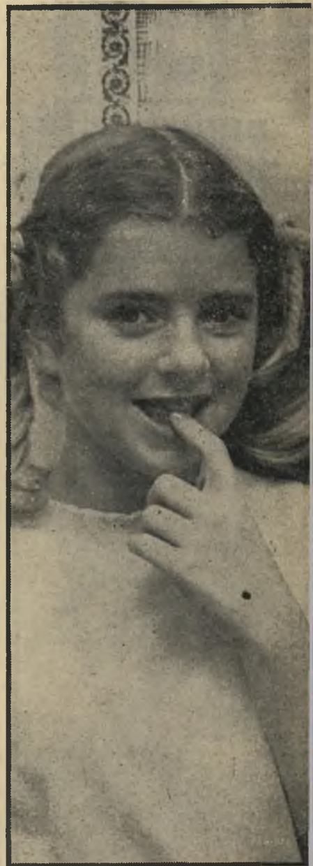
„ראש ממשלה זה כמו הנשיא אצלנו? אז אני רוצה לפגוש אותה. כי היא ממש כמו סבתא שלי!“