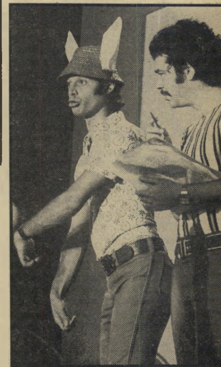
ברקן ויניג ב"קונגרס הצחוק" שודדים עם קונפייטר

נעורים, כשגנבים התחשבו עדיין במצבו המשפחתי של הקרבן המיועד ושדוך בעזרת קונפייטר ולא מכוונת יריה, כל אלה יזכו לרגעים נעימים, לקולה של שושנה דמארי, ולכמה הופעות קצרות של עמריד החוץ במטאטא כמו טימן, יהלומי וגולנד. גדי יגיל ויהודה ברקן, שני הבדרנים האפנתיים ביותר היום, ודאי יעוררו צחוקים רבים, וקולה של מיירי אלוני אינו נוסל במאומה מקולו-תייהם של כל הזמרים הישראליים שקמו