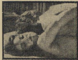
עשו מיספר ומפסוטים

מדור זה הוא תוספת למהון המפורסם של דן בן־אמוץ ונתיבה בן־יהודה. הקוראים מוזמנים לשלוח למערכת מלים וכיטוויים משנהב.