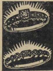
איזה יותר שווה?