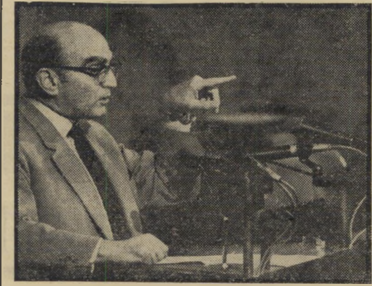
האונס: עקרונות וכסאות

האונס — חסדו), / אבל היכן הגבול קשישי — בירעם / או זכות-עבר בדחות חורבת בית-יכנסת? יש גבול לאונס המצפון... — וזה מזכיר / בדיחה על גברת שהכרתי / אשר סיפרה: ,אתמול מנעתי אונס, / פשוט מאד, כיוון שהתמסרתו". וממפ"ם ל"ע. בשנים הגורליות, שבהן גובשה ונכ" פתה הכפייה הדתית על המדינה, והפכה לחלק מן המיש" טר — היה שרי-המישפטים מנהיג הל"ע, פינחס רוזן. מעשיו היו מעשי פינחס ושכר מיפלגתו — שכר זמירי. מכנסת לכנסת שיתפו ל"ע פעולה בהגברת הכפייה הדתית, עד לכנסת הנוכחית, שבה