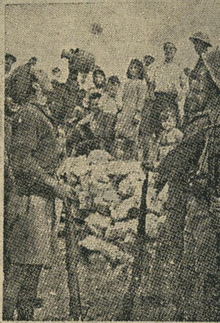
מנצי ישראלי בקפריסין נפגש עם בני המיעוטים בג'רר