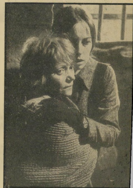
לילה קדובה וג'ראלדין צ'אפלין, אם ובתה בסרט, בסצינת חרדה טרנסמישפט, בו נדונה האם ל-10 שנות עבודת-פרך בשל רצונה לעלות.

את עצמו על ספינת נהר, בעזרת סכין מטבח ובקבוק וודקה, או את שיטות הי חקירה במרתפי המישטרה-החשאת הי שואבים השראתם (אפילו בתאורה) הישר מההודאה של קוסטס גבראס.