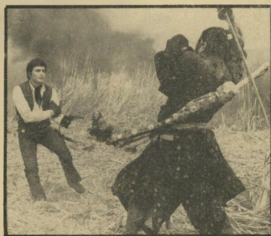
מיפונה ודילון: סמוראים ומופלאים

מה שקורה לכל אלה אינו מן הדברים המקוריים ביותר שאפשר להעלות על הדעת. יש כאן אינדיאנים רצחנים ופושעים צמאי דם, וסיפור שמתקדם דילוגים ומנתר מעלילה