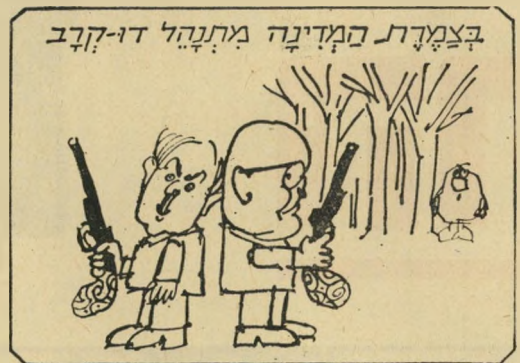
צילה מנוסי ב'לוח הכפול

* הכוונה להסכם ניכסון-קוסיגין להגבלת החימוש של ברית-מ' וארה"ב.