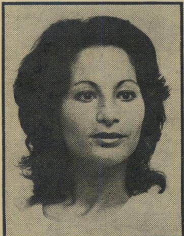
אם לאינשווא דיין — אסונות אהבה

אמרה לו, "אני לא רוצה שום ביטוח, תס' תלק מכאן כי אני אקרא למישטרה." ברח האיש ונעלם.