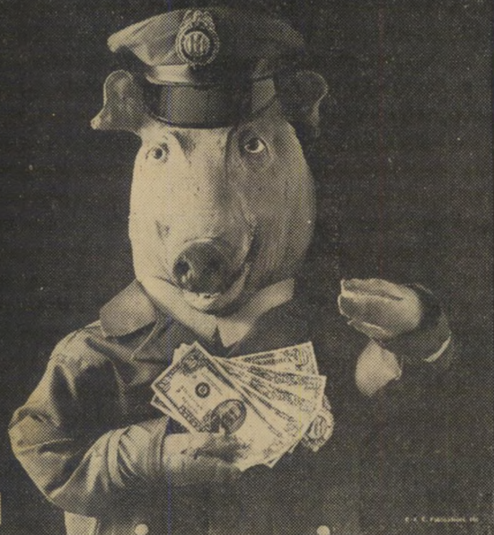
המודעה ההיתולית של "מר" דאג ששטרנינו ישארו כשרים!

אחד הנכסים העיקריים של מיטרת ישראל היא תדמיתו של השוטר הישראלי. למרות שתהיה זו הגזמה רבה לומר שהוא נהנה מצד הציבור מיחסים של ה ערכה ואמון כמו השוטר הבריטי, למשל, הרי אין להשוות כלל את מצבו למצבם של שוטרי פאריס או ניו-יורק, שהפכו בעיני חוגים רחבים לסמל שגוא המייצג את תכונות ה עריצות והדיכוי של השילטון.