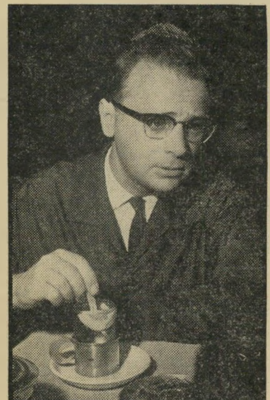
ומוצל ראדף - הצילה ממוות

אביו גילה אכזריות חלקית בהציעו להסיר-עה עד לפתח הבסיס ממש. אך היתנה את רוחב ליבו בבילוי משותף קצר ב-