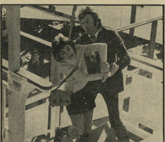
איסטווד וואלטר: ההערצה הרועצת

זה הסיפור שבחר קלינט איסטווד לסרט חראשון שביים, והתוצאה בהחלט ראויה לצפייה, בעיקר על-ידי בעלי העצבים החזקים. איסטווד, נעזר כנראה לא מעט בדון ("הארי המזוהם") סיגל, האיש שביים לאחרונה את מרבית סרטיו והנחשב ליורטואזו של הקולנוע האמריקאי. הבמאי איסטווד מצליח להוביל את הסרט מאווירה של בטלנות חסרת דאגה בתחילתו, אל שיאים של מריט-עצבים בסופו. כל הצוות הסכני שעמד לצידו, ובראשם הצלם ברוס סורטיס, הם אנשים העובדים עם סיגל, ואין צורך לשיר את שבחיהם, ואילו החשקנית שנבחרה לגלם את דמות הנערה המופרעת, ג'סיקה ואלתר, היא משכנעת עד כדי כך שגם הצופים יתחילו, לקראת סוף הסרט, לפחד מפניה. אמנם, אפשר עדיין להשגיח בעובדה שאיסטווד לא צבר די נסיון כדי לשתום את כל החורים שבעלילה, וטיי-